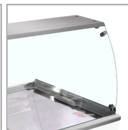
Välvat glas för fin