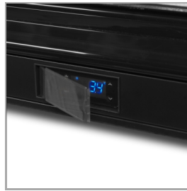
Skyddshölje på termostat